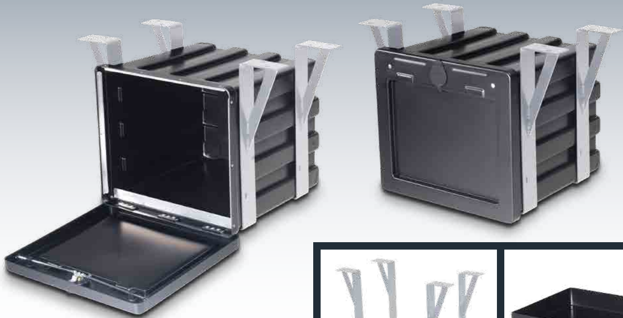
Abb.: 3-Punkt-Verriegelung mit Zubehör