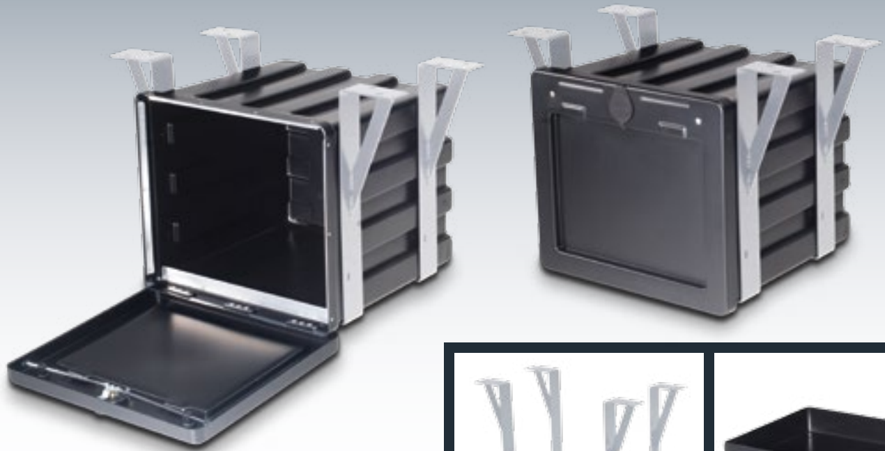
Abb.: 3-Punkt-Verriegelung mit Zubehör