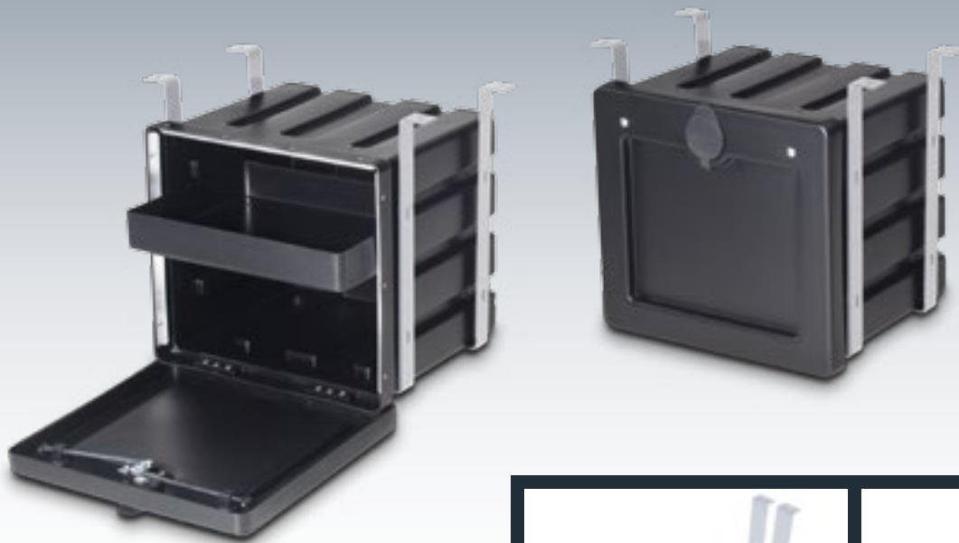
Abb.: 3-Punkt-Verriegelung mit Zubehör